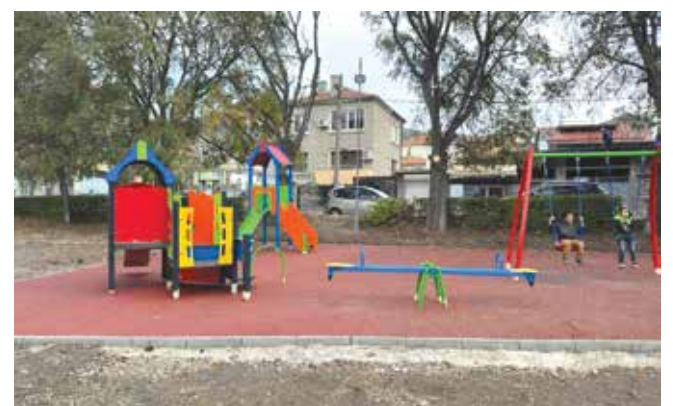
Новата детска площадка до болницата