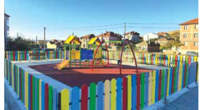
Детската площадка на ул. „Христо Кърджолов“ в Айтос

Общата стойност на проекта е в размер на 58 273.28 лв., като финансовата помощ е в размер 100 на сто от общия размер на допустимите за финансово подпомагане разходи.