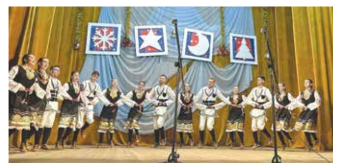
Благотворителният концерт в читалището

Пълната зала беше впечатлена най-вече от социалната чувствителност и ангажираността на младите участници в концерта, с проблемите на едно друго поколение, което те малко познават.