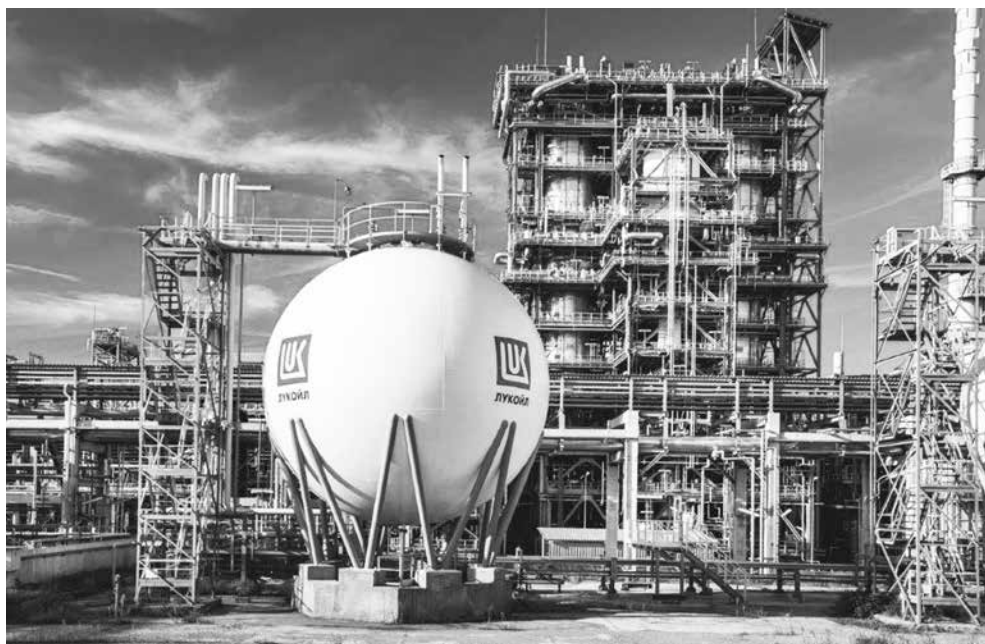
За изминалата година предприятието е преработило 6,2 млн. тона нефтена суровина

„ЛУКОЙЛ Нефтохим Бургас“ увери членовете на Обществения съвет, че ще продължава добросъвестно да изпълнява мисията си – да осигурява висококачествени горива за българския и регионалния пазар, да изпълнява задълженията си към държавата и ангажиментите си към работниците, партньорите си и обществото. Каква ще е съдбата на най-голямата и модерна рафинерия на Балканите? Дали ще последва съдбата на много други български предприятия, които „не случиха“ на стопанин, или ще устои на политическите бури и ще продължава да бъде гарант за енергийната сигурност на страната? Предишното да видим.