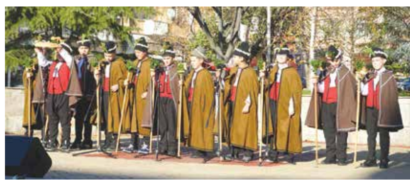
Коледарите на СУ „Н. Й. Вапцаров“, гр. Айтос