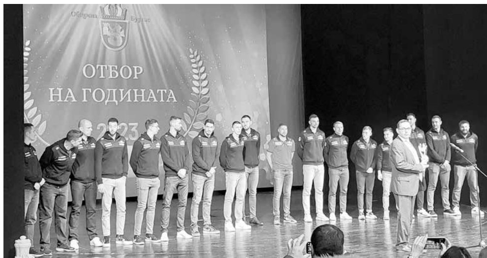
Отборът на годината е волейболният „Нефтохимик 2010“