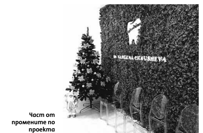
Част от промените по проекта

Настоящата публикация е осъществена с финансовата помощ на Европейски земеделски фонд за развитие на селските райони във връзка със Споразумение за изпълнение на Стратегията за водено от общностите местно развитие № РД50-146/21.10.2016 г. по подмярка 19.4 „Текущи разходи и популяризиране на стратегията за водено от общностите местно развитие“ на мярката 19 „Водено от общностите местно развитие“ на Програмата за развитие на селските райони за периода 2014 - 2020 г.