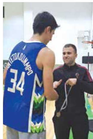
В Спортна зала „Аетос“

Две благотворителни инициативи „Подари коледна вечеря на пенсионер в нужда“ организира на 14 и 17 декември т.г. Сдружение „Бъди човек“ – Айтос. Благотворителният концерт, който препълни залата на читалището, се превърна в изключително събитие за местните. Не само заради успешна благотворителна кампания на сдружението, която ще зарадва предколедно немалко самотни възрастни хора от общината.