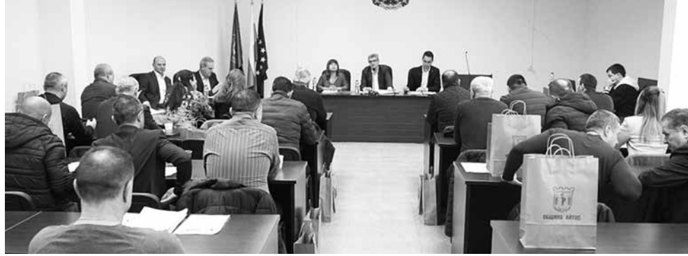
ОБС заседава предколедно на 19 декември