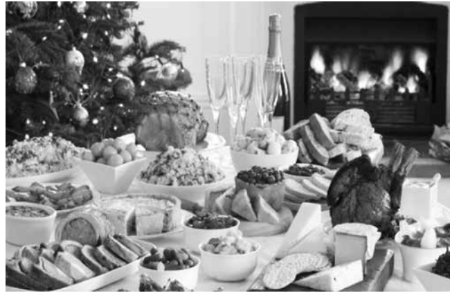
Поставянето на богата Новогодишна софра няма за цел единствено да ни нахрани, тя носи със себе си послание за благополучие, прогрес, благоденствие