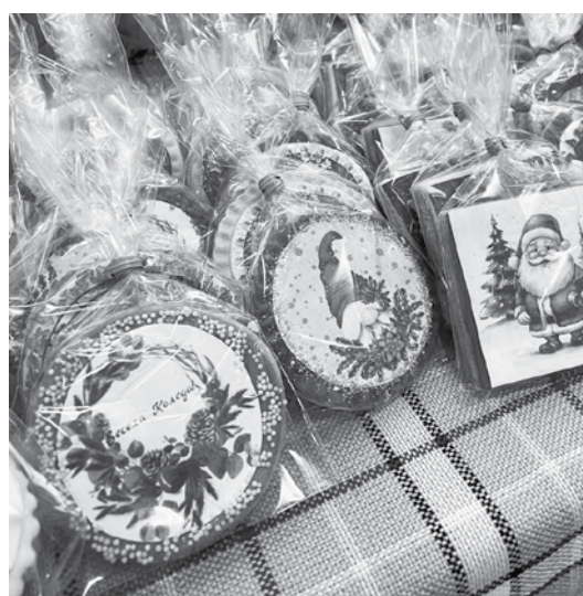
Благотворителните коледни базари са ежегодна, традиционна инициатива