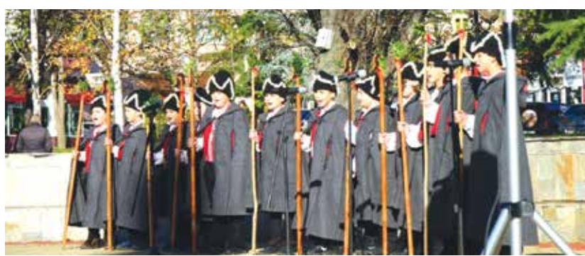
1-во място за обредната група с колежари на СУ „Христо Ботев“, гр. Айтос

Девет бяха коледарските групи тази година. Общо над 200 деца участваха в конкурсите. Успоредно с представянето на традиционните песни и обреди, във фоайето на НЧ „Васил Левски 1869“ – Айтос беше подредена изложба на автентични сур-