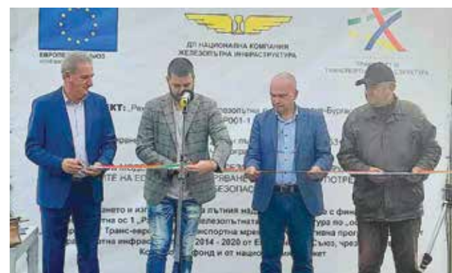
Край с. Малка поляна, прерязаха лентата за откриването на два надлеза в участъка Черноград – Българово