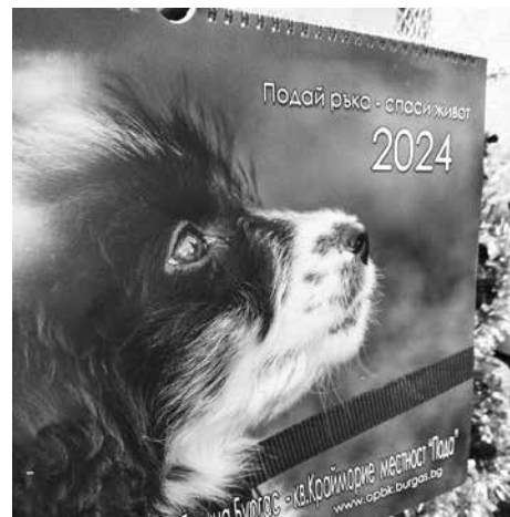
И тази година покупката на календари помага на четириногите от приюта