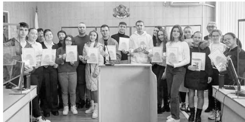
Участниците в конкурса в съдебната зала на РС-Айтос

На 8 декември, в Районен съд – Айтос се проведе заключителният етап на Образователна програма „Съдебната власт – информиран избор и гражданско доверие. Отворени съдилища и прокуратури“ за учебната 2022/2023г. За тазгодишния финал на Програмата магистратите обявиха конкурс за есе на тема „Чистата ми