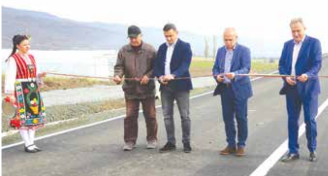
Откриването на двата надлеза в междугарието Черноград – Айтос