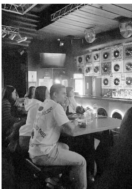
Младите хора организират събитието за трета поредна година

„Винаги гледаме някакви коледни филми. Тази година изборът ни беше „Тайните служби на Дядо Коледа“ – анимационен, но смея да твърдя, че беше доста интересен. Стремим се винаги филмите да са хем интересни, хем да не е „Сам вкъщи“, който се дава по всяка една телевизия по време на коледните празници. Проведохме и една томбола, от която имаше и два печеливши. Много хубаво се получи“, сподели младежката дама.