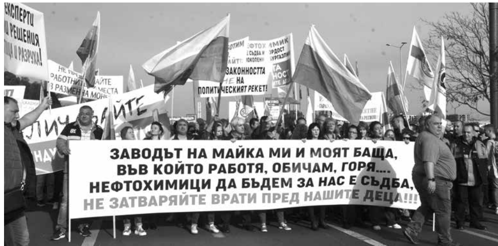
През есента работещите в рафинерията излязоха на протест в Бургас в защита на високотехнологичен отрасъл, какъвто е предприятието