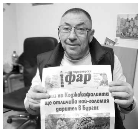
Легендарният футболист Божидар Искренов – „Радостта на народа“