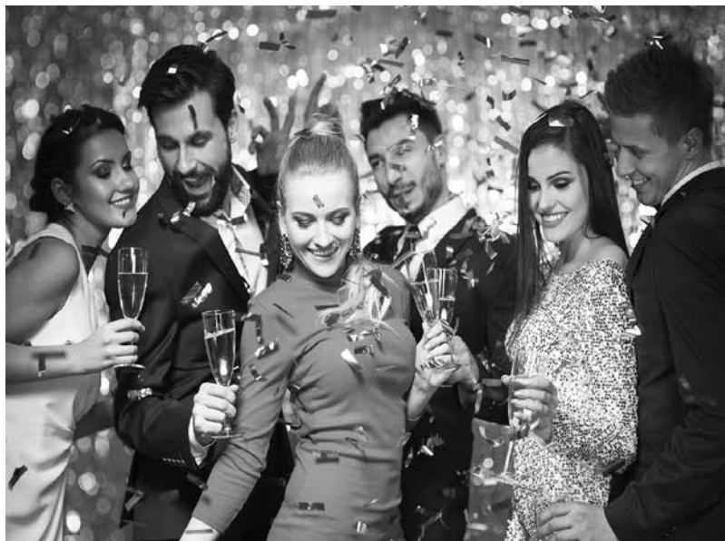
Новогодишната нощ все повече е празник, отколкото задължение за приготвяне на обилна трапеза

За Нова година. Оферти – Всекиму според възможностите