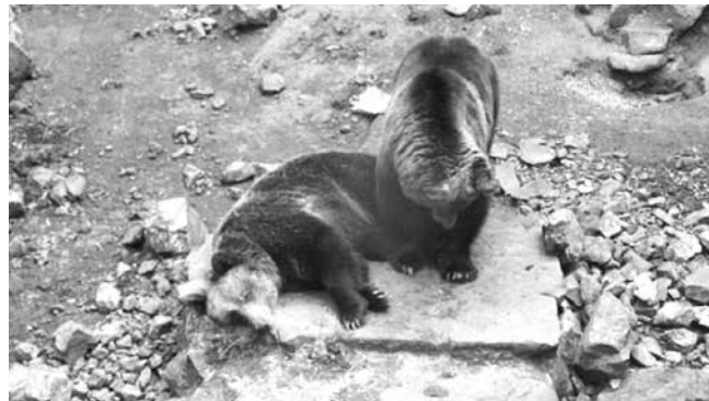
Айтоските мечки ще сменят бърлогата с просторен мечкарник

В тази връзка, първият подобект е образователен център, който ще бъде изграден на мястото на сегашното