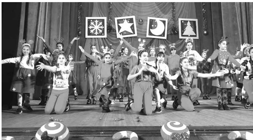
На 19 декември, в салона на читалището, Вълшебната читалищна работилница на НЧ „Васил Левски 1869“ сътвори КОЛЕДНО ЧУДО с прекрасните деца от читалищните състави. Пълният салон горещо аплодира тази сценична коледна магия!

Коледарски поздрав на децата от ДГ „Детелина“ с. Тополица към кмета и общинската администрация