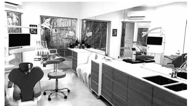
Амбулатория за първична помощ по дентална медицина

Общата стойност на проекта е в размер на 122 642.36 лв., като финансовата помощ е в размер 75 на сто от общия размер на допустимите за финансово подпомагане разходи.