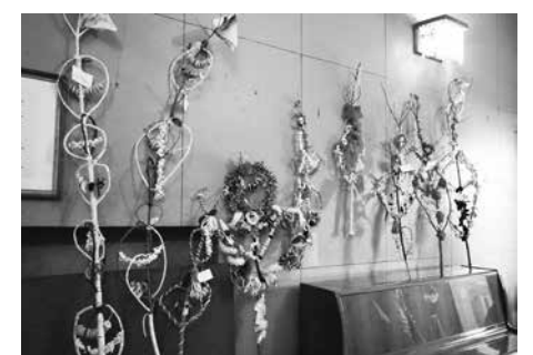
Изкусно изработени сурвачки наредиха на изложбата в читалището учениците от ПГСС „Златна нива“ – Айтос

3. място: Гинка Йорганова – 5 клас, ОУ „Атанас Манчев“ гр. Айтос