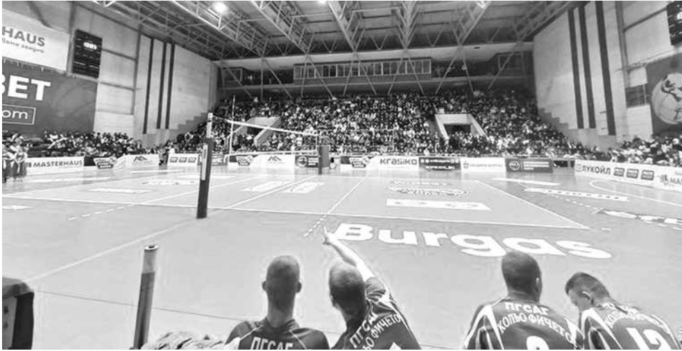
„Това не е снимка от финална среща на Национална волейболна лига. Това е благотворителен волейболен мач между отборите на ПГЧЕ „Васил Левски“ – гр. Бургас и ПГСАГ „Кольо Фичето“, Бургас“ – написа Иван Станев, публикувайки в социалната мрежа кадър от препълнената зала „Младост“

Добротворци. Концерт и волейболен мач, организиран от ученици, събра над 15 хиляди лева за пострадал в катастрофа