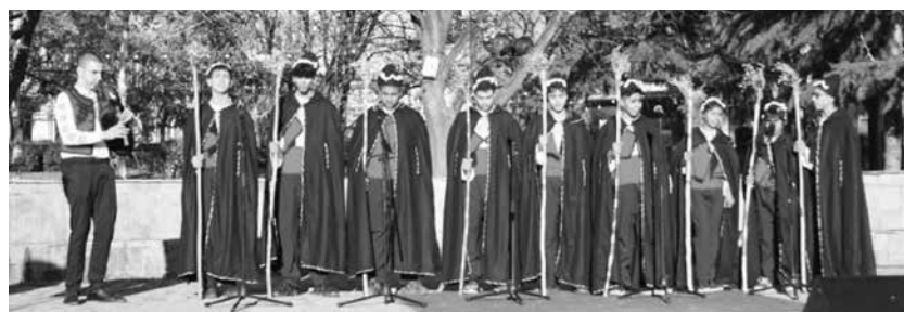
И ОУ „Атанас Манчев“ – Айтос впечатли публиката с коледарската си група

ПРОФЕСИОНАЛНА ГИМНАЗИЯ ПО СЕЛСКО СТОПАНСТВО „ЗЛАТНА НИВА“ ГРАД АЙТОС ул. „Славянска“ № 50, тел. 0888/206682, e-mail: info-200114@edu.mon.bg О Б Я В А