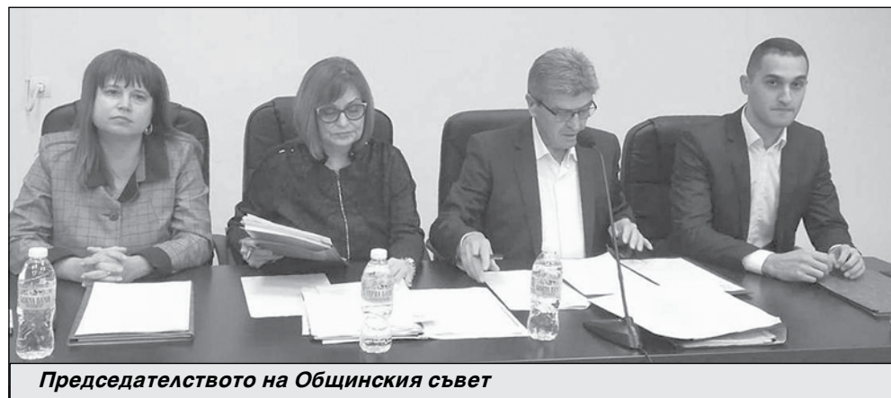
Председателството на Общинския съвет