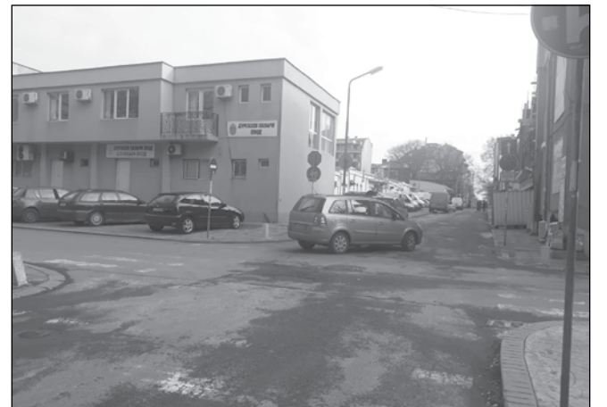
Улица „Цариградска“ - в тази отсечка са желаещите да влязат в „синята зона“. В най-скоро време Общината ще започне ремонт, най-вероятно след това улицата ще попадне в обхвата на „синята зона“. Това обаче надали ще реши проблема с намирането на паркоместа, защото автомобилите в района са твърде много и всеки иска колата му да е пред дома