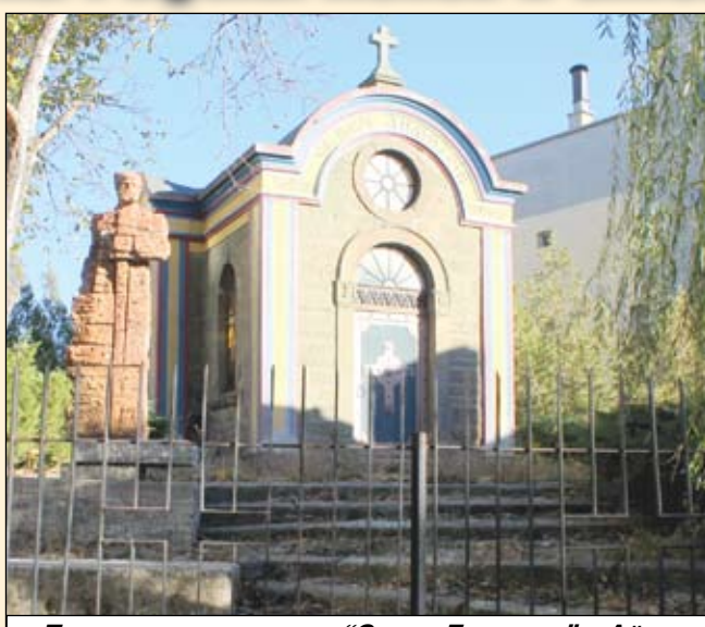
Параклист-костница „Свети Димитър“ в Айтос

В началото на месец януари 1878 година започнали безчинства, пожари, грабежи и малтретиране на българското население. Слухът, че към града са се насочили черкезки и башибузушки банди, хвърлил в още по-голяма паника българите. Много семейства се принуждават да изоставят родните си огнища, имот и покъщнина, и да потърсят спасение в Поморие, Бургас и околните на Айтос балкански села. Своеволията над беззащитното население, останало в града, още по-силно затвърди-