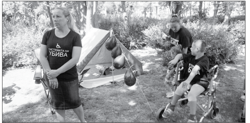
Деца с над 90% степен на увреждане ще получат асистентска подкрепа, но след като минат нова процедура - оценка на индивидуалните им потребности, т. нар. второ сито

Хората с увреждания се оплакват и от друг проблем - неправилната преценка на степента на увреждане.