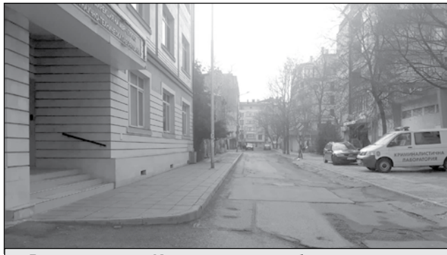
Районът около Криминалната лаборатория, живеещите се оплакаха по време на обсъждане, че униформените им взимат местата за паркиране

„Синята зона“ в Бургас по всичко изглежда, че ще „отхапне“ още едно парче в квартал „Възраждане“. Жи-