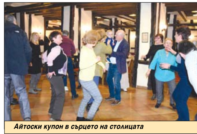
Айтоски купон в сърцето на столицата