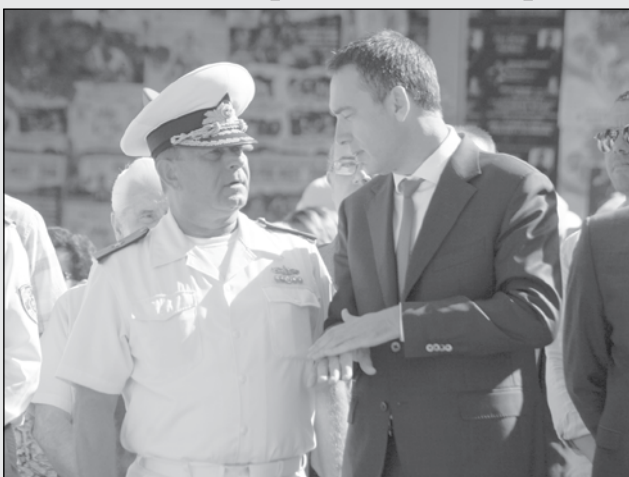
Пенсионираният флотилен адмирал Мален Чубенков (вляво)