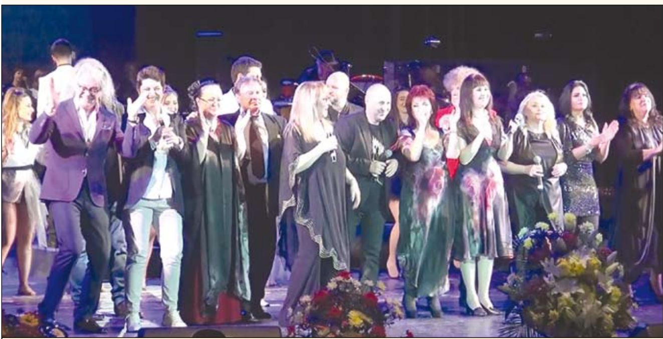
Няколко поколения певци излязоха на сцената, за да изпеят песните по стихове на Пею Пантелеев